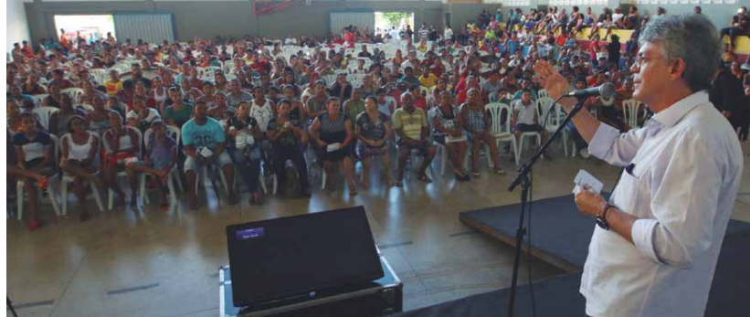
352 unidades habitacionais Governador Ricardo Coutinho sorteou apartamentos do residencial Thomas More, em Várzea Nova. Investimento superior a R$ 19 milhões. Página 3

O poeta lança mão de sua licença, e diz: "no silêncio da noite". Mas, não há noite silenciosa. Desliguem-se o disjuntor geral e todos os motores da cidade, e ter-se-á as lutas corporais das pressas com os predadores, a sinfonia lúgubre dos pássaros, insetos e aranhas. A ópera extravagante dos galos e cadornos. Já a chuva, sopra o vento, está o trovão. Um ruído melancólico aplaca o ritmo, e o canto se desprega e voa pelos ares, desfigurando o corpo da cidade. Página 11