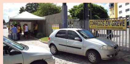
Com a greve, cerca de 400 mil correspondências deixarão de ser entregues para Paraíba

O movimento sindical serão reivindicadas, entre outras medidas, a reforma da Previdência e trabalhista, "que são temas de cunho constitucional e de políticas governamentais dos quais os Correios não possuem governabilidade, não havendo qualquer possibilidade de tais temas serem objetos de pautas de negociações entre a empresa e as entidades representativas dos empregados", diz a nota.