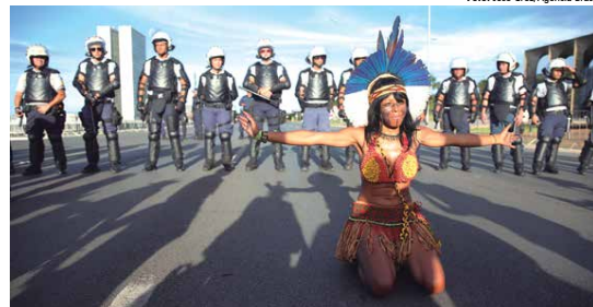
Protesto Acampamento Terra Livre promove novo ato na Esplanada dos Ministérios em defesa das etnias. Página 18