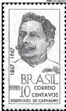
São dois Correios em homenagem ao poeta