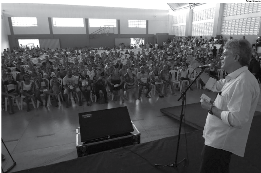
Governador destacou a importância de sair do aluguel e entrou que nos próximos meses a cidade de Santa Rita vai ganhar outro importante investimento, o Hospital Metropolitano

Com tráfego diário de 259 veículos, a rodovia tem uma extensão de 16,1km beneficiando uma população de 20.356 habitantes