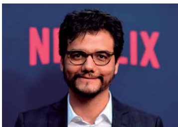
Celeo Wagner Moura participa de uma palestra multitemática no domingo

o multifacetado Wagner Moura. Com uma bagagem artística reconhecida, o ator e diretor, premiado nacional e internacionalmente, vem à Paraíba para participar do Campus Festival. Dentro da programação, o ator vai realizar um bate-papo com o público, no último dia de evento, às 20h30, dentro das palestras multitemáticas.