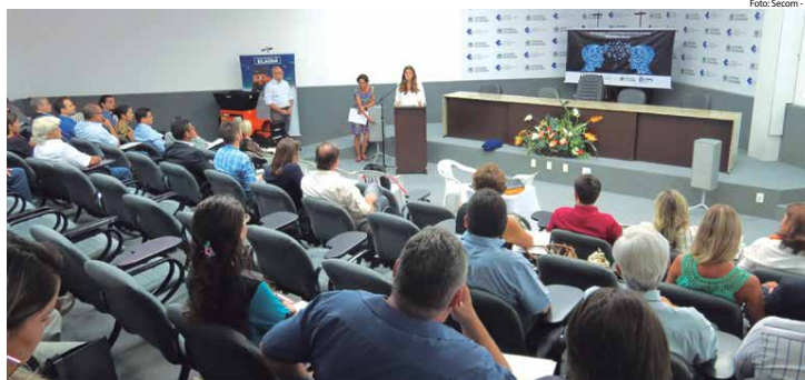
Representantes de universidades, empresários, inventores e estudantes discutiram questões ligadas à área da ciência, tecnologia e empreendedorismo

A Cinep tem firmado com o INPI (Instituto Nacional da Propriedade Industrial) um acordo de cooperação técnica, por meio do qual a companhia abriga em suas