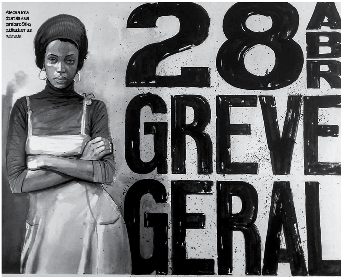
Atredoria do artista visual paraibano Shiko, publicada em sua rede social